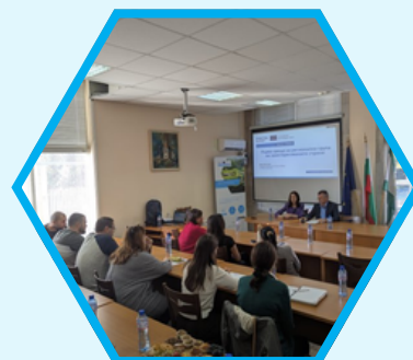
Бяла Слатина, България